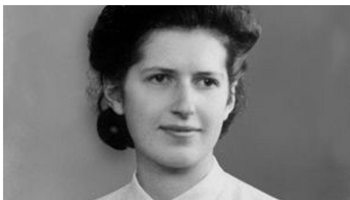
Geneviève de Gaulle - Anthonioz